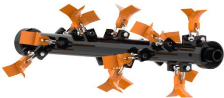
Rotore elicoidale Helicoidal Rotor